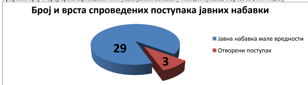
Графикон број 1: Број, врста спроведених поступака јавних набавки у ЈКП „Комуналац“, Врбас за 2018. годину

Укупна процењена вредност јавних набавки које су реализоване током 2018. године износила је 142.015.000 динара без ПДВ-а.