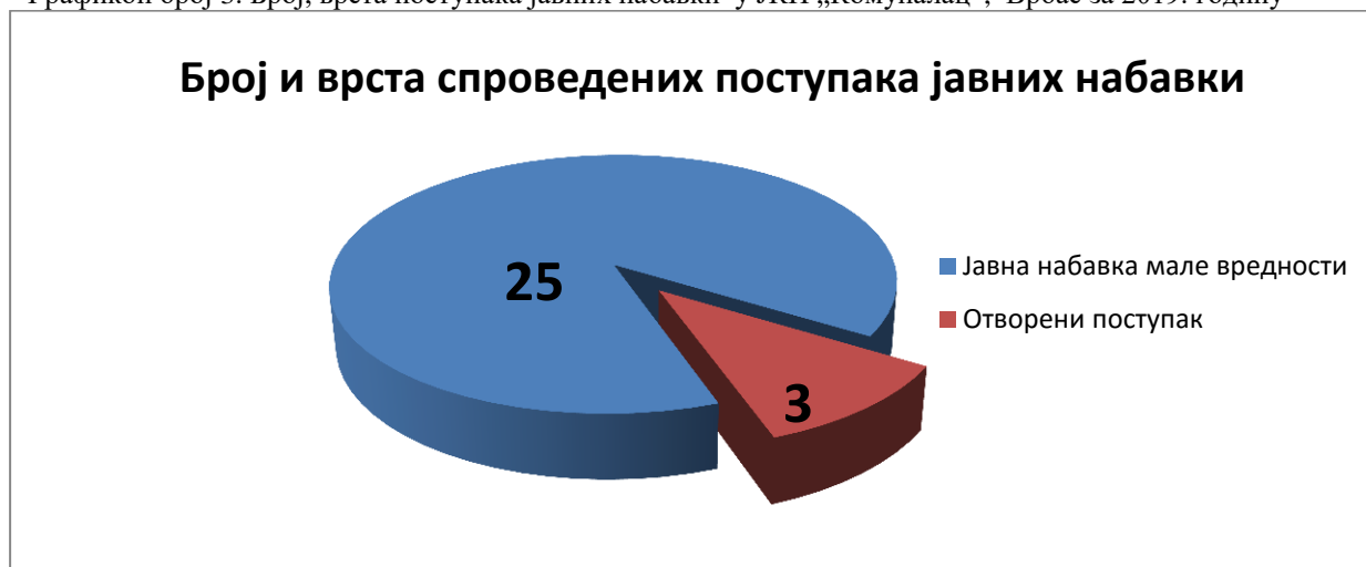
Табела број 2: Преглед неправилно спроведених поступака јавних набавки у 2019. години

Графикон број 3. Број, врста поступака јавних набавки у ЈКП „Комуналац“, Врбас за 2019. годину